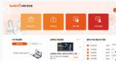
<삼양식품그룹 스마트 연수원>

삼양식품과 협력사 임직원을 대상으로 CRM / PLM / APS / 글로벌 유통 등 다양한 직무관련 오프라인 교육특강과 삼양식품 그룹 스마트 연수원 온라인러닝 과정을 제공하고 있습니다.