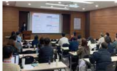
<협력업체 대상 품질안전 세미나(23.02)>