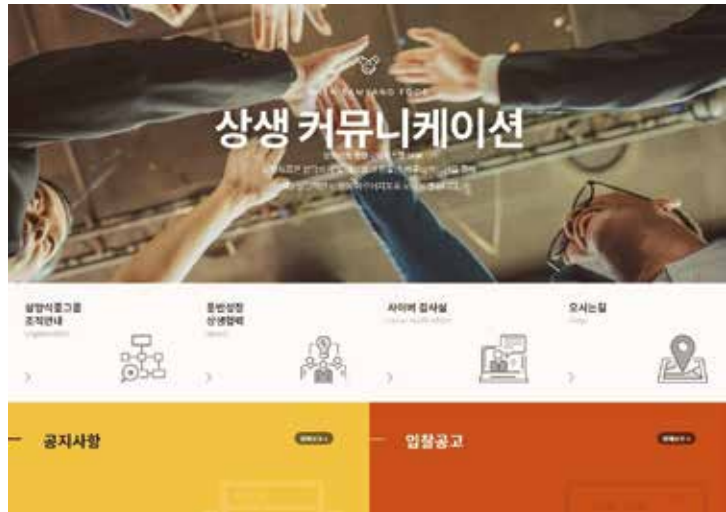
삼양식품 통합구매 협력사 포털(SRM) : srm.samyangfoods.com